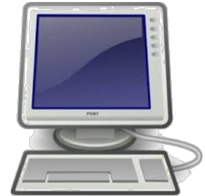
ओनलाइन तपासणी व मंजूरी